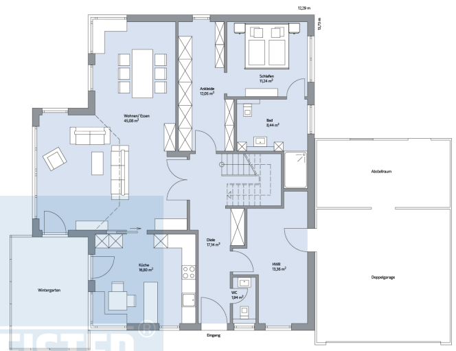
Haus Wellenberg Grundriss