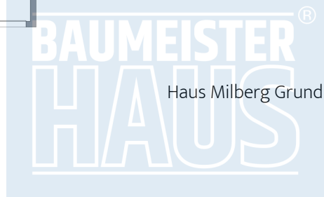
Haus Milberg Grundriss OG