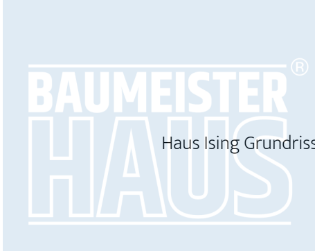
Haus Ising Grundriss OG